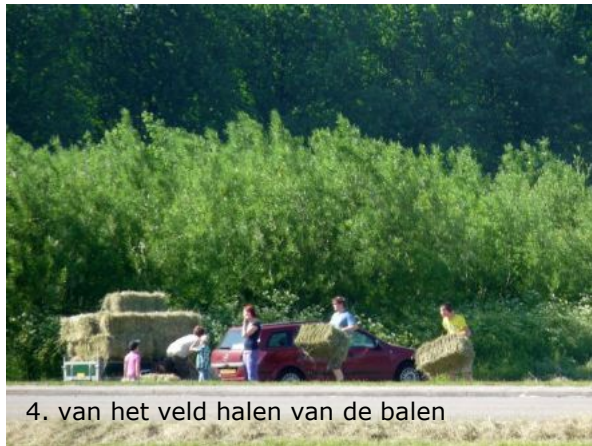
4. van het veld halen van de balen