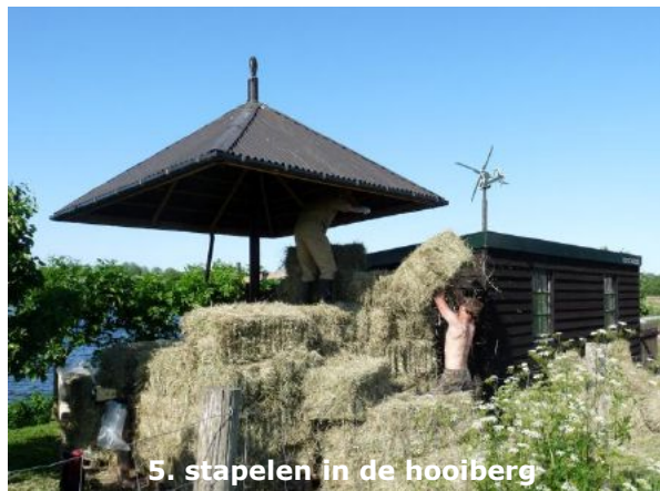
5. stapelen in de hooiberg