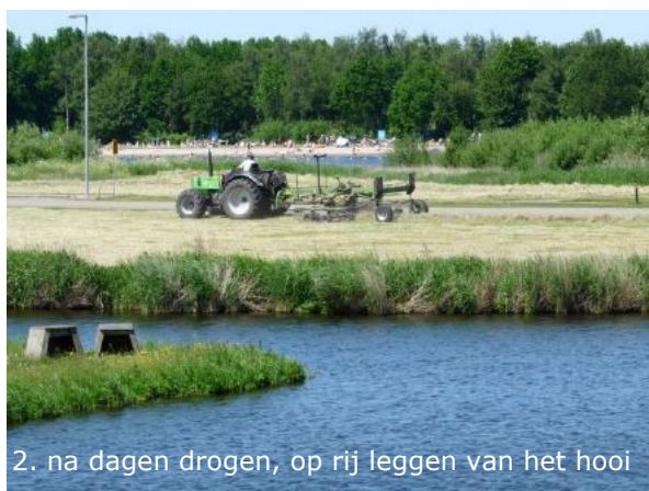
2. na dagen drogen, op rij leggen van het hooi