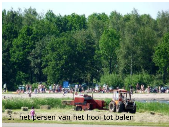
3. het persen van het hooi tot balen