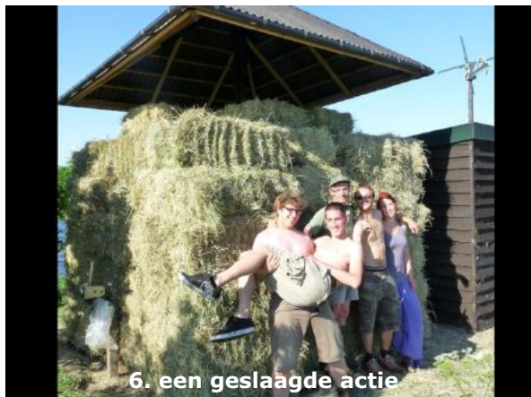
6. een geslaagde actie