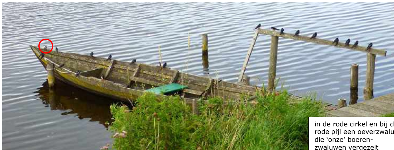
in de rode cirkel en bij de rode pijl een oeverzwaluw die 'onze' boerenzwaluwen vergezelt

Als de wieken draaien, gebruiken de zwaluwen natuurlijk ook andere rustplaatsen waaronder de stokken en rekken in de moestuin. Maar ook de rieten molenkap is een geliefde rustplaats.