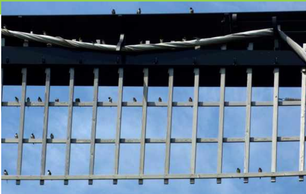
foto boven: 29 boeren zwaluwen beelden hun eigen gekwetter uit in bladmuziek

En als het gevlucht stil staat, kwetteren ze graag zittend op de heklatten. Hun steeds weer veranderende positie op de wieken met bijbehorend heerlijk gezang, geeft ons steeds weer het gevoel dat ze hun eigen bladmuziek uitbeelden.