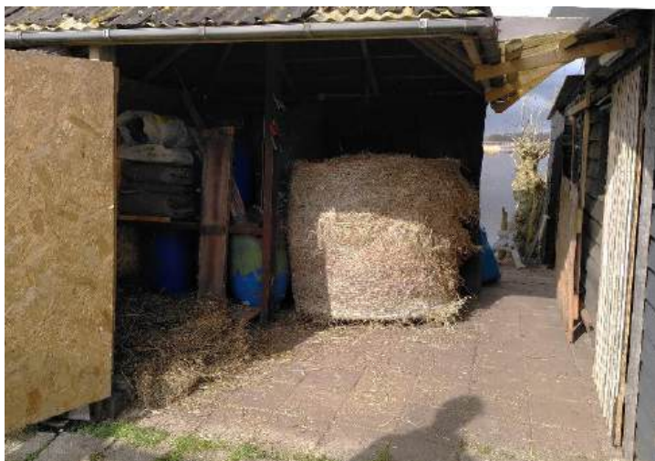
foto rechts: de hooiberg heeft nu een grote openslaande deur waar de omvangrijke hooibaal naar binnen gerold kan worden. Bij de baal op de foto is het zwarte plastic reeds verwijderd

Bij het schrijven van deze nieuwsbrief, eind maart, schiet het groen al de grond uit en lopen de viervoeters al lekker in de molenbiotop te eten van het eerste frisse groen. We zien dan ook dat de hooiruiven minder snel leeg raken.