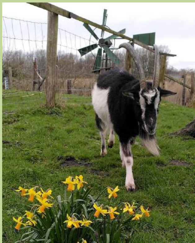
april: komst van divers nieuw leven op het erf van de Twiskemolen