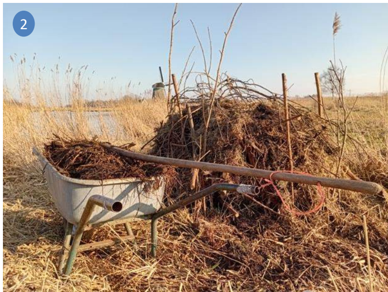
opbouw broeihoop: 1: takken, 2: mest, 3: maaisel