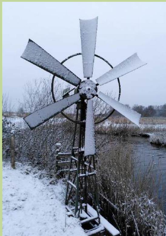
januari: best wel winters

Dit jaar is begonnen met in de eerste maanden veel weerswisselingen; vorst, sneeuw, storm, regendagen en zelfs bijna zomerse temperaturen met stralende zon. De foto's hieronder zeggen genoeg.