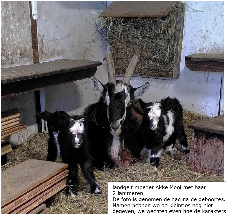
landgeit moeder Akke Mooi met haar 2 lammeren. De foto is genomen de dag na de geboortes. Namen hebben we de kleintjes nog niet gegeven, we wachten even hoe de karakters zich ontwikkelen

Nadien hebben nog 3 geiten fraaie lammeren gekregen. Er lopen nu 7 lammeren in de wei. 1 Geit loopt, bij het ter perse gaan van deze nieuwsbrief nog met een dikke buik. We zijn benieuwd naar haar kleintjes.