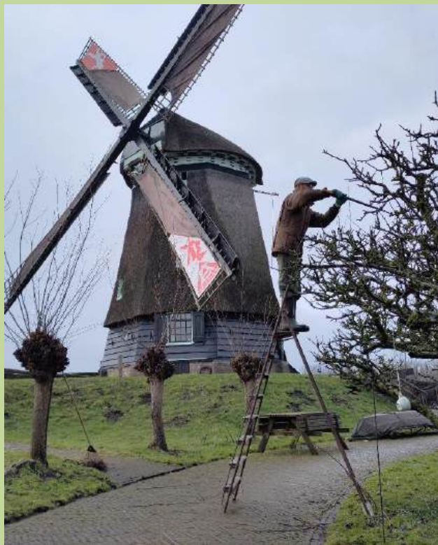
februari: veel snoeiwerk te doen